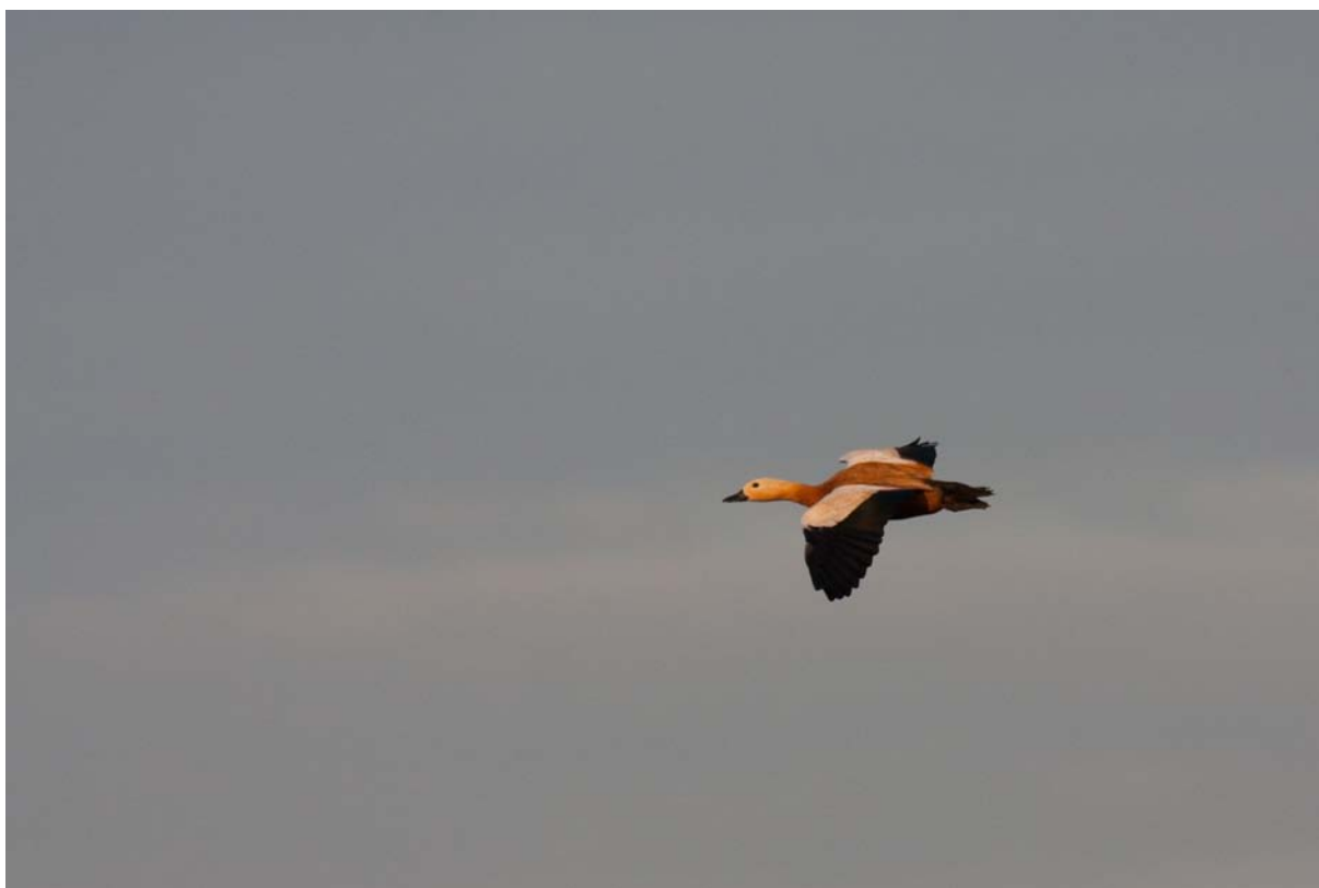
Rostgans, Wagbachniederung, 1. August 2009