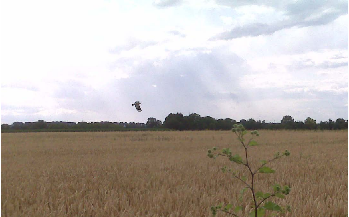
Wiedehopf, Mannheim - Sandtorfer Bruch, 08.07.2009