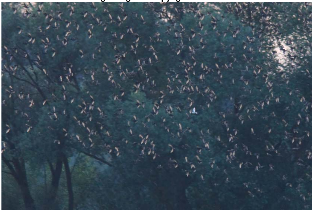
Zurzeit versammeln sich bis zu 10 000 Stare an ihrem Schlafplatz in der Wagbahniederung. Darunter auch ein Albino und mehrere Teilalbinos

Für alle Abbildungen liegt das Copyright © bei den Bildautoren!