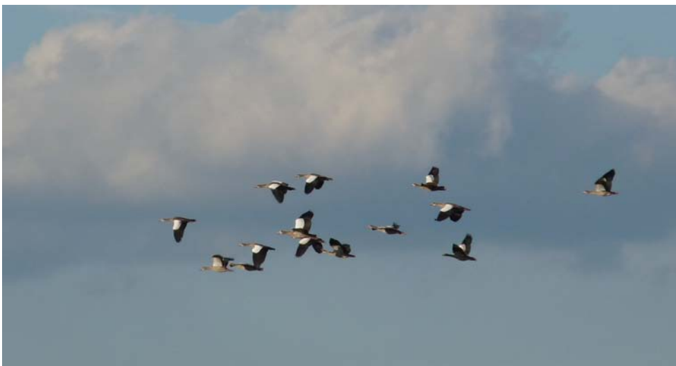
Nilgänse, Ladenburg, 30.08.2009