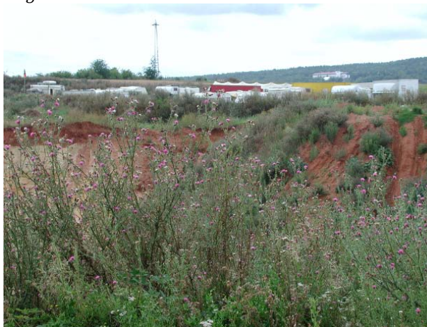
Sandgrube bei Eisenberg (Pfalz), 02.08.2009

Später erfuhr ich, dass das erste Augustwochenende noch gar nicht das eigentliche "Trial-Event" war, das fand erst am 7./8. August statt! Das heißt, dass die Vögel mind. eine Woche lang diesen Beeinträchtigungen ausgesetzt waren...“