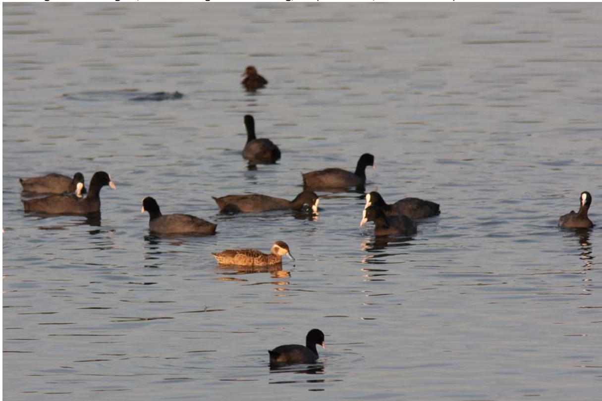
Hottentottenente zwischen Blässhühneren, Wagbachniederung 01.08.2009