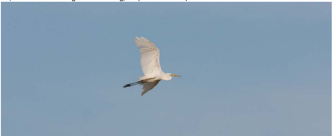
Silberreiher, Wagbachniederung, August 2009

1 Ind. 01.8.09 Wagbachniederung_SO, KA (R. Martin) mind. 6 Ind., 03.-09.08.2009 Wagbachniederung, KA (U. Mahler u.a.) 1 Ind. 09.8.09 Wagbachniederung, KA (R. Martin, J. Roeder) max. 8 Ind., 10.-16.08.2009 Wagbachniederung, KA (U. Mahler u.a.) 2 Ind. 22.8.09 Wagbachniederung, KA (H. Bott) max. 15 Ind., 17.-23.8.2009 Wagbachniederung, KA (U. Mahler u.a.) max. 12 Ind, 24.-30.8.2009 Wagbachniederung, KA (U. Mahler u.a.)