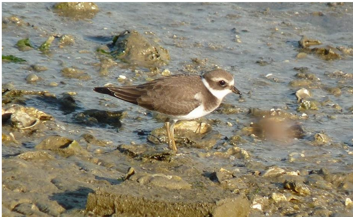
Juv. Sandregenpfeifer, Wagbachniederung, 08.08.2010

1 juv. 08.08.2010 Wagbachniederung, KA