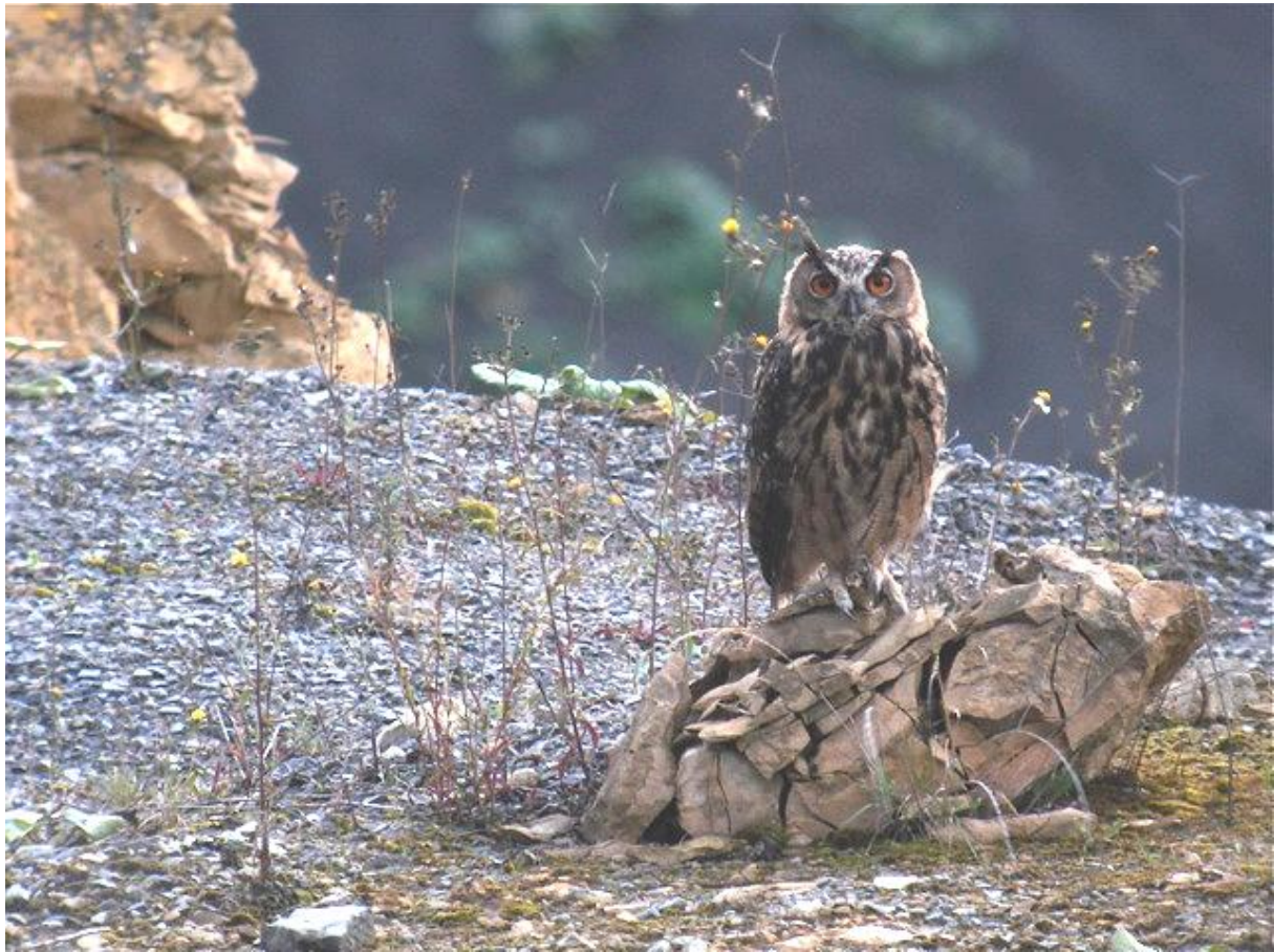
Uhu, 20.08.2010