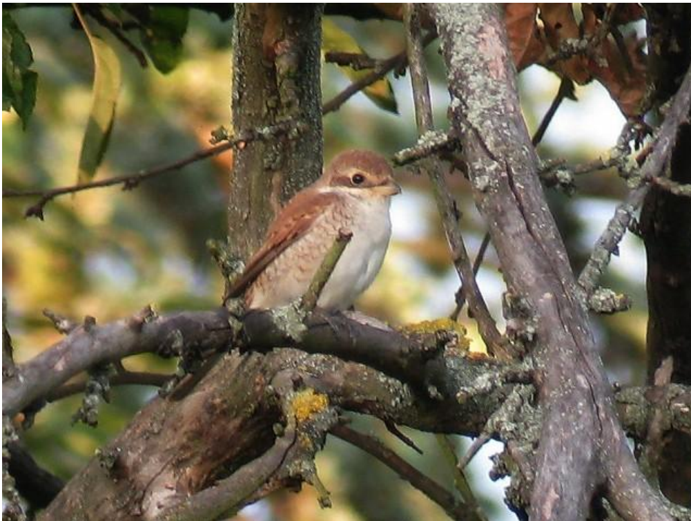
Weibl, Neuntöter, Ludwigshafen (Friesenheimer Insel) 6. Aug. 2010