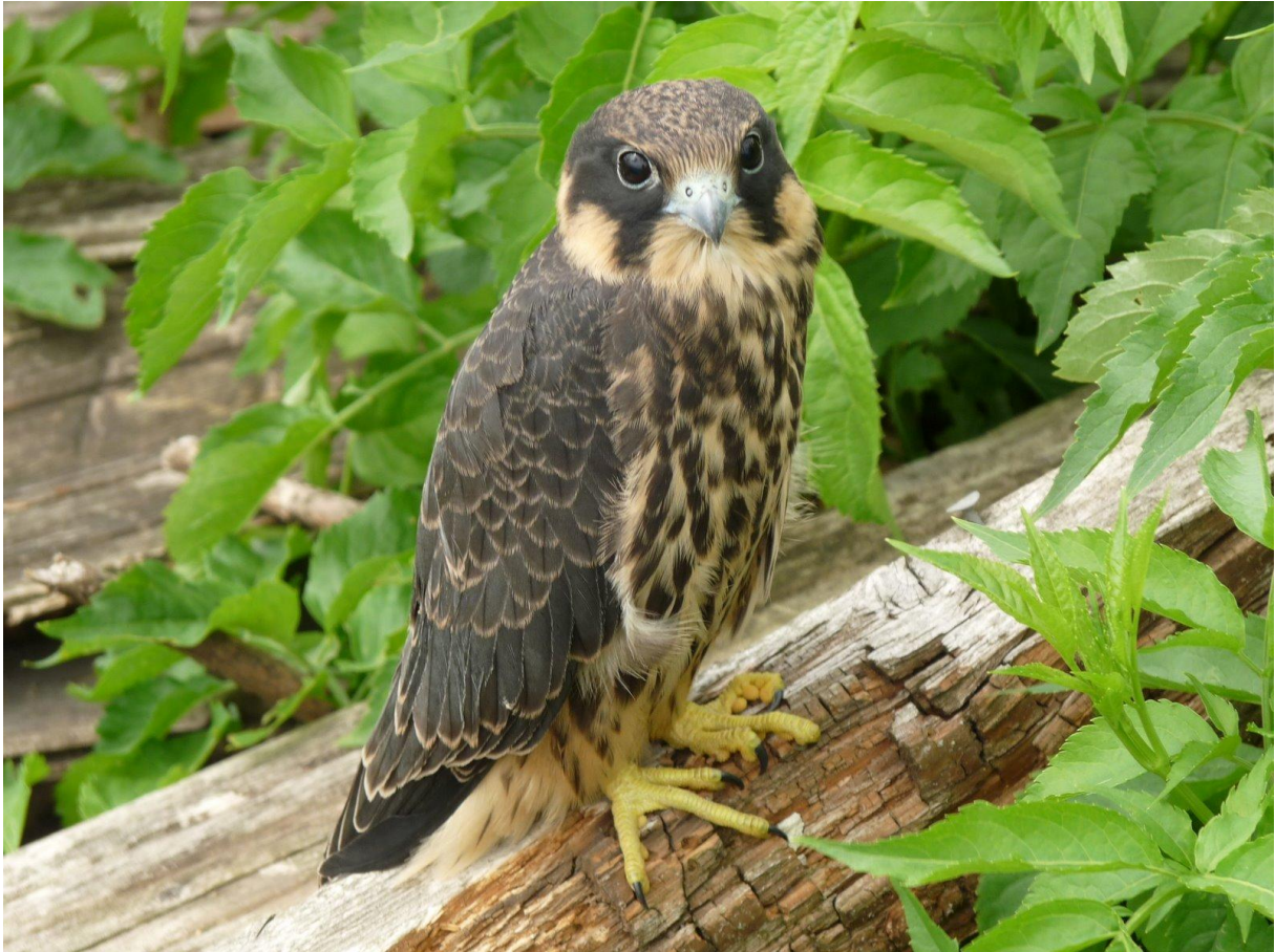
Ein eben flügge geworden Baumfalke auf dem Boden, Mannheim, 11.08.2010