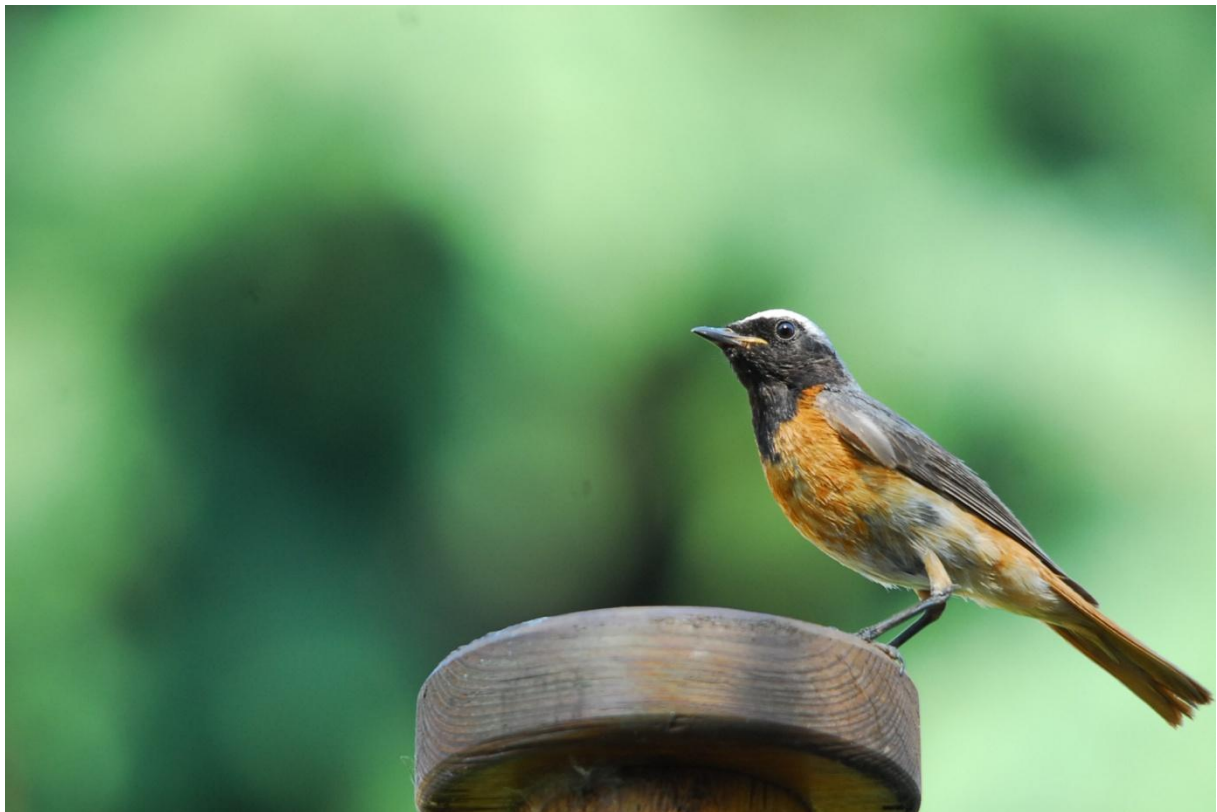
Gartenrotschwanz, Mannheim-Neckarau, Juni 2010

im August ist der erste Höhepunkt des Limikolenzugs. Für die, die nicht in den Urlaub verreist sind, ein gute Gelegenheit auch weniger häufige Zuggäste zu beobachten. Manche müssen schon früher aufgebrochen sein, denn ich konnte die ersten „Europäer“ im August bereits in Tansania beobachten (Flussuferläufer, Kampfläufer)