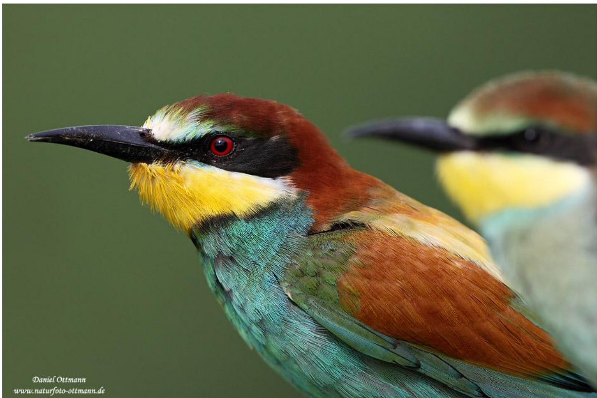
Bienenfresser, Rhein-Neckar-Kreis, 8. Aug. 2010