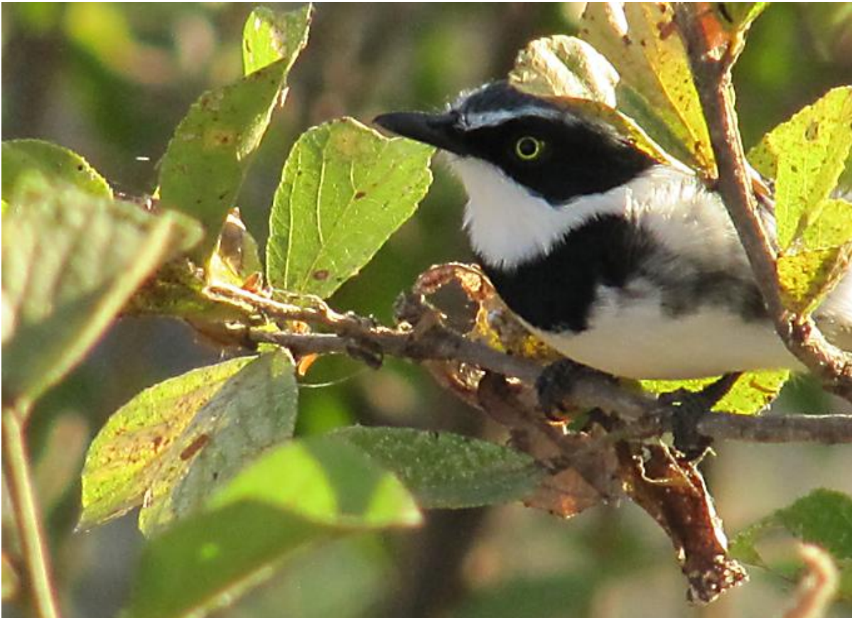
Weißflankenbatis, Männchen, Tarangire Nationalpark, Tanzania, Aug 2010

Weißflankenbatis ( Batis molitor ) (engl.: Chin-spot Batis ), 10 cm,