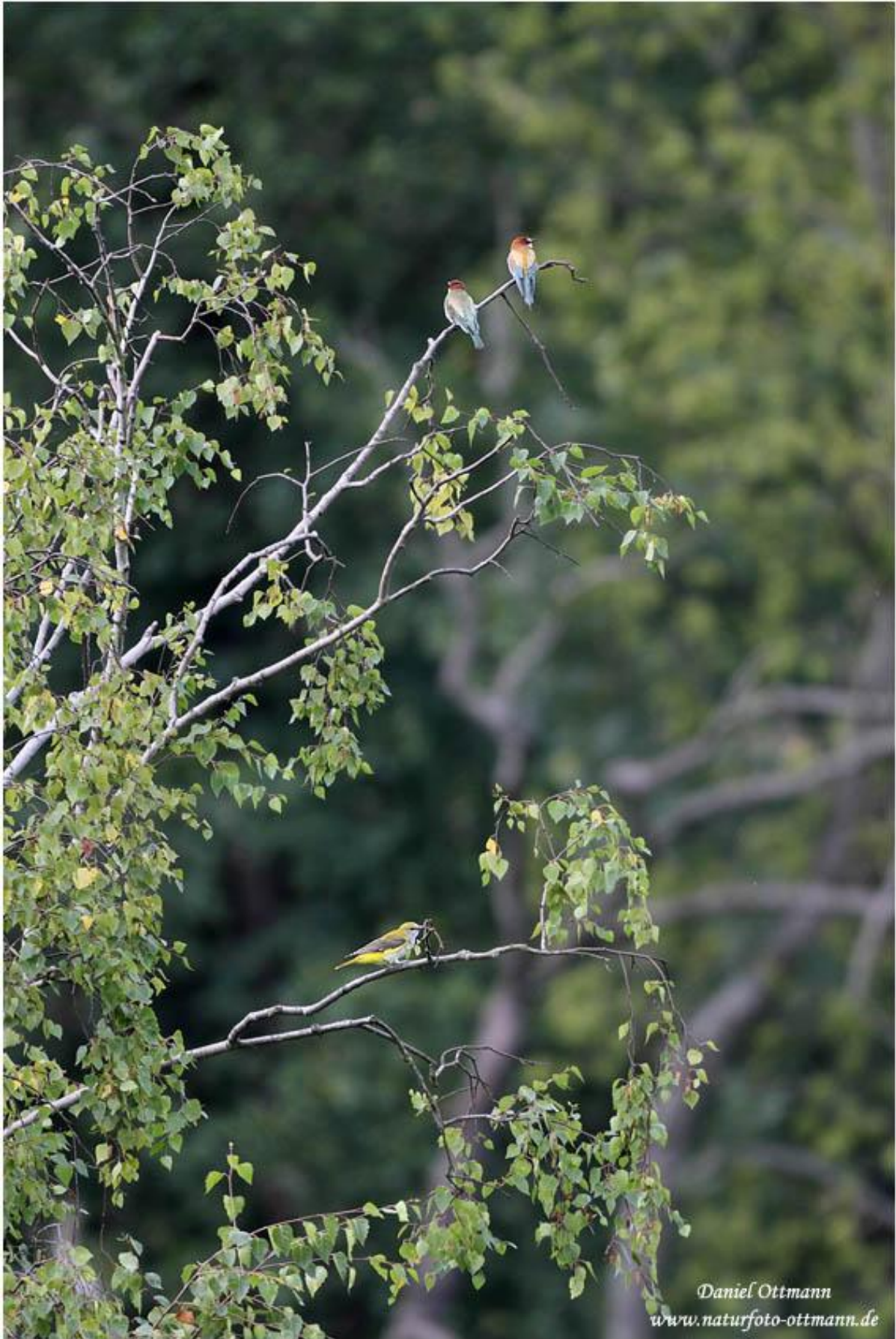
Bienenfresser und Pirol, Rhein-Neckar-Kreis, 08.08.2010