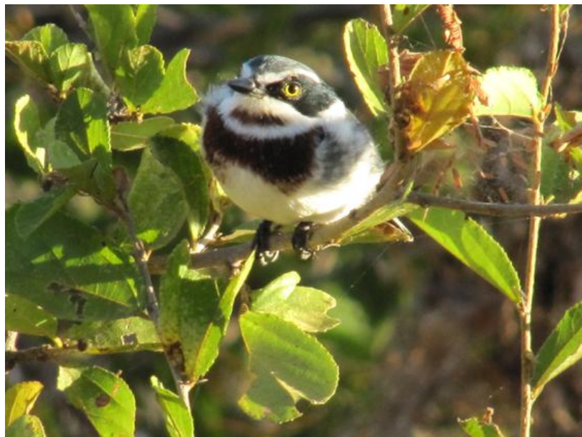
Weißflankenbatis, Weibchen, Tarangire Nationalpark, Tanzania, Aug 2010

Die Weißflankenbatis treten meist paarweise auf in Busch- oder Waldgebieten von 500-3000 m Höhe. Ihr Verbreitungsgebiet reicht von Uganda und Kenia im Norden bis Südafrika. Der englische Namen des Weißflankenbatis bezieht sich auf den braunen Kehlfleck der Weibchen.