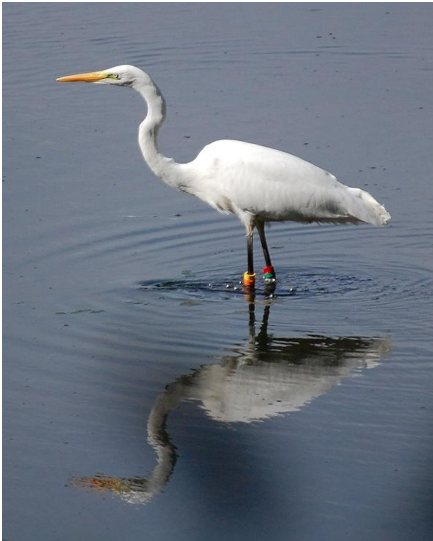
Farbberingter Silberreiher (Egretta alba)

12. 08.2010 und 26.08.2010 NSG Weingartner Moor, KA